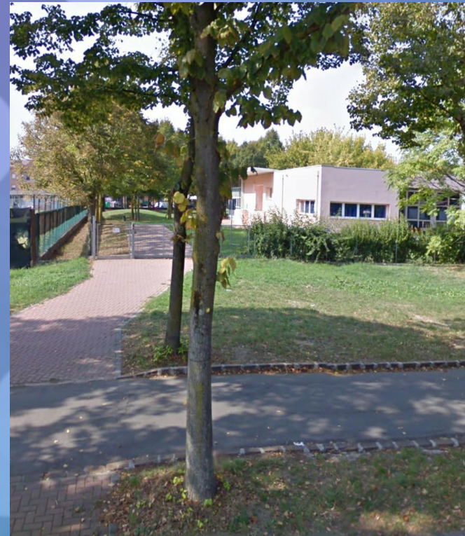
VIA ARGINETTO Accesso per 4 sezioni: 4, 5 Blu e 3, 5 Gialli