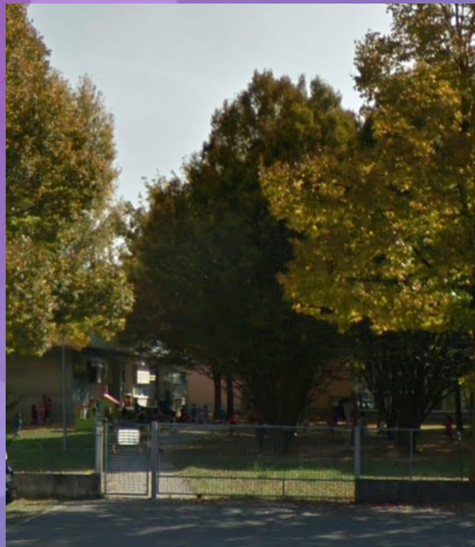
VIA CADUTI Accesso per 4 sezioni: 3, 4, 5 Rossi e 4 Azzurri